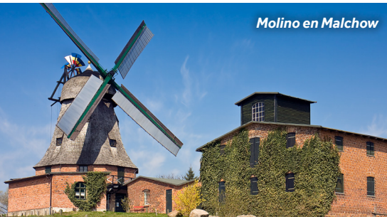
Molino en Malchow