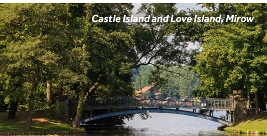
Castle Island and Love Island, Mirow