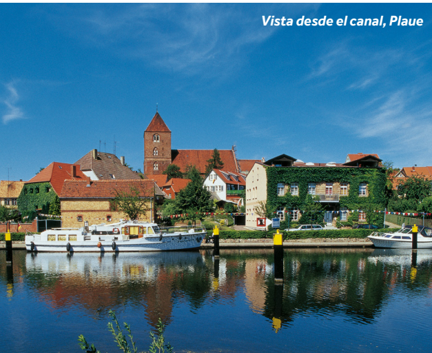
Vista desde el canal, Plaue